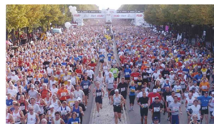
Non, ce n'est pas (encore) la course du PEV!

Sponsorisez un coureur, ou courez pour le PEV! Pas besoin d'être un grand sportif... mais se faire plaisir tout en soutenant le PEV, en vous faisant sponsoriser par vos amis et famille pour chaque tour parcouru (400m). S'inscrire au préalable avec le formulaire. Durée de la course: 15 minutes.